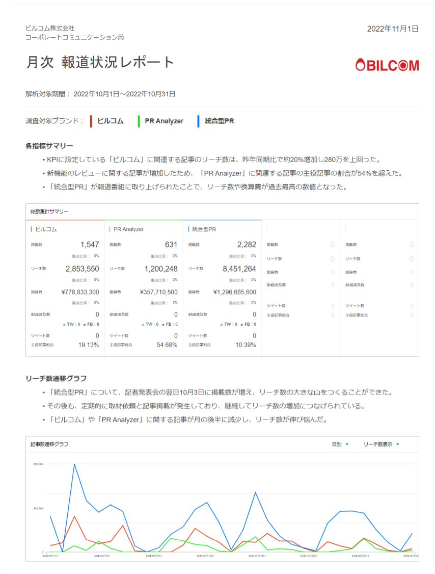
報道レポート機能で PDF 出力したレポートサンプル

そこで、PR Analyzer では、ブラウザ上でユーザーが自由にグラフやテキストを組み合わせることで PDF 形式のレポートを作成できる本機能を開発しました。また、ユーザーからの「どのような内容のレポートを作成すればよいかわからない。」というお悩みにお応えするため、約 20 年にわたって企業の広報・PR を支援してきた当社のノウハウを活かしたテンプレートを 3 種用意しています。これらテンプレートを使用することで、PR Analyzer 導入後すぐに報道レポートの作成が可能です。